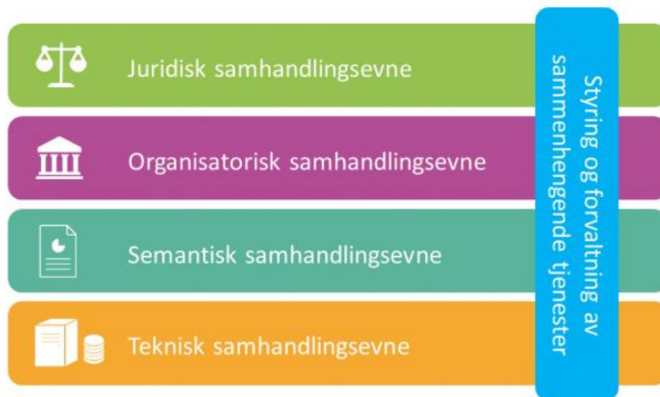
Figur 2 Rammeverk for digital samhandling, EIF-modellen (Digitaliseringsdirektoratet)

For å få til god digital samhandlingsevne er det nødvendig med enighet, felles forståelse og støtte i alle lag i rammeverk for digital samhandling (EIF-modellen i Figur 2).