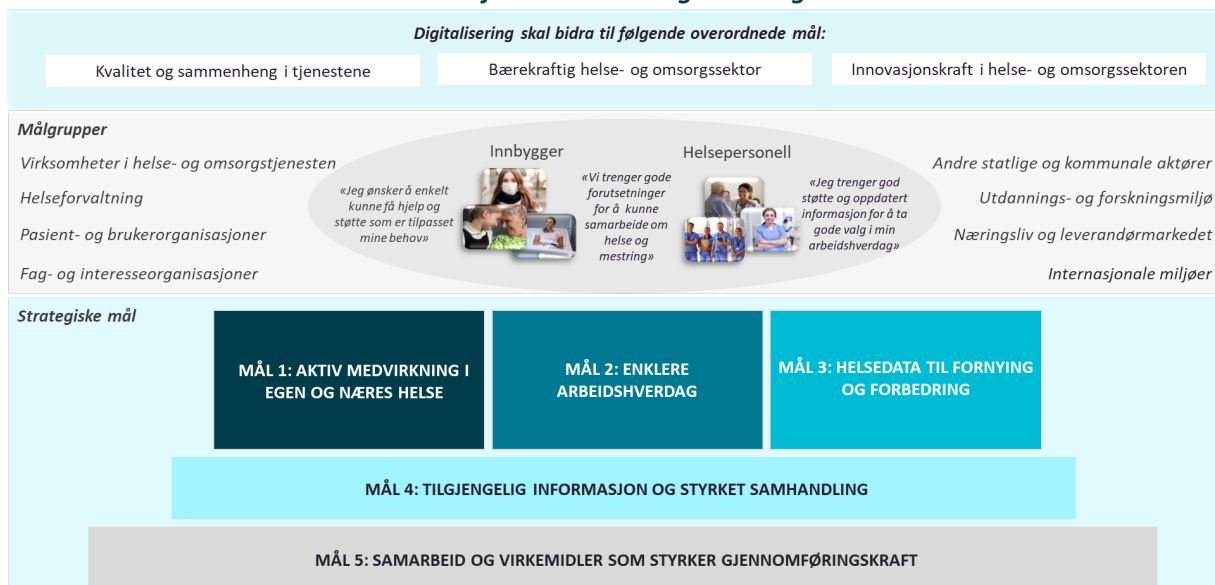
Figur 3. De fem strategiske målene skal bidra til strategiens visjon, overordnede mål og målgruppenes behov

De fem strategiske målene er viktige hver for seg, men de henger tett sammen og er gjensidig avhengige av hverandre. Det betyr at vi ikke kan løse ett og ett mål, men at målene må løses parallelt. Helt overordnet kan vi si at mål 1-3 er mål som skal gi direkte nytte til målgruppene i strategien, mens mål 4 og 5 er tilretteleggende mål som adresserer tema som er forutsetninger for å lykkes med mål 1, 2 og 3.