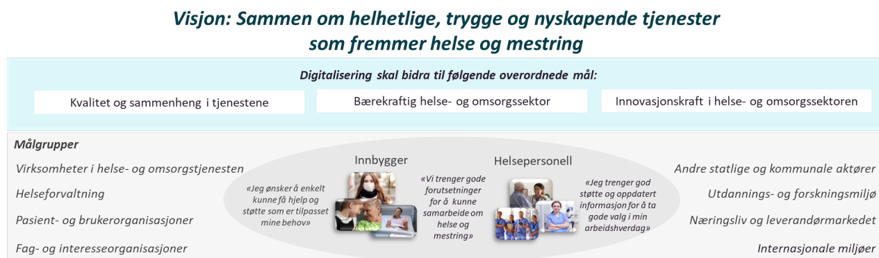
Figur 2. Visjonen setter retning for digitaliseringsarbeidet i helse- og omsorgssektoren. For å realisere visjonen skal det arbeides mot å nå de tre overordnede målene for digitalisering og møte behov hos strategiens målgrupper.

I Figur 2 oppsummeres visjonen sammen med de tre overordnede målene for digitalisering av helse- og omsorgssektoren og strategiens målgrupper. Samlet oppsummerer illustrasjonen « hva » man ønsker å oppnå gjennom strategien.